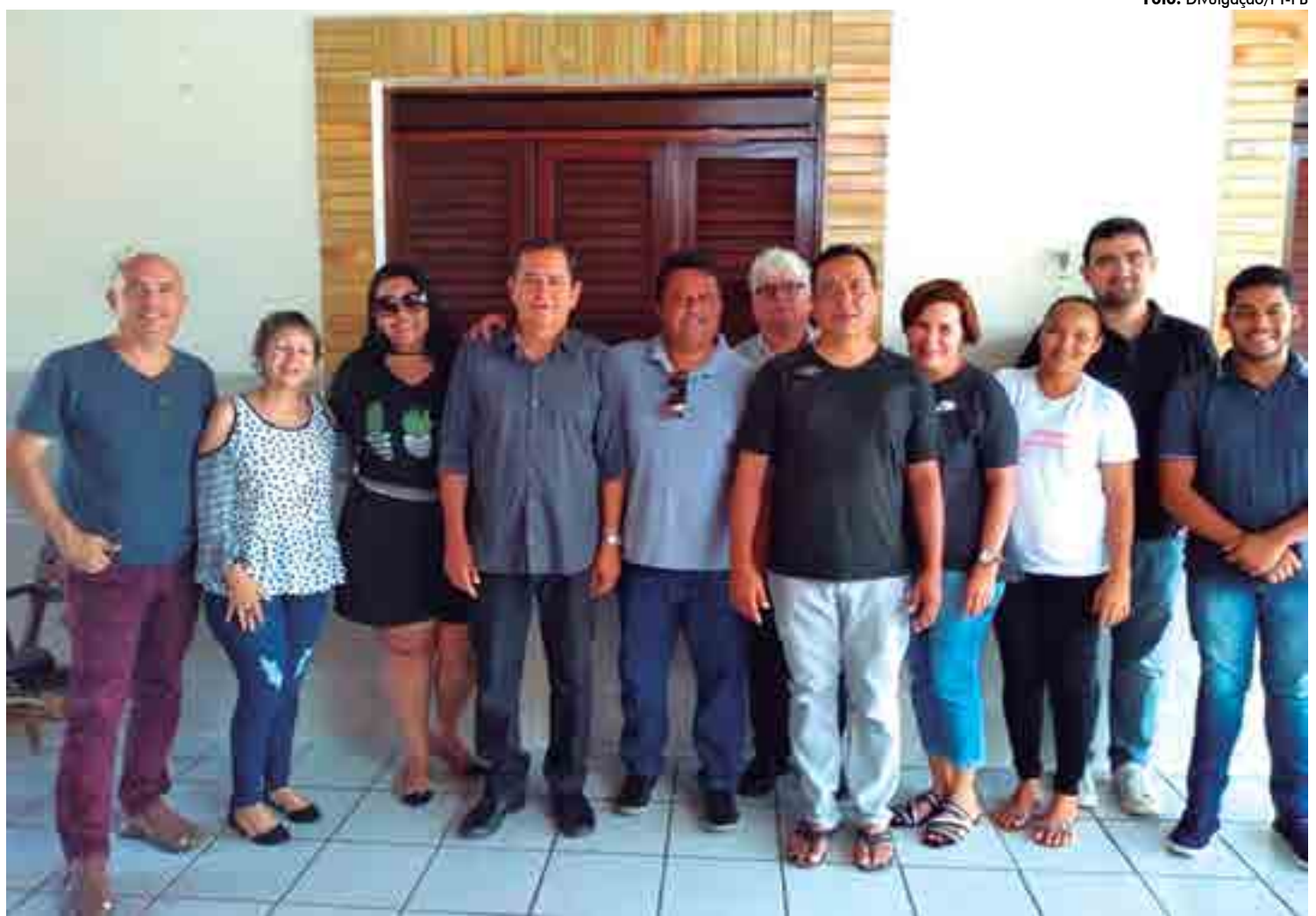
Foi o PT que recorreu ao TSE e conseguiu uma liminar suspendendo a realização das eleições suplementares que estavam previstas para o dia 9 de dezembro

Consta também na Resolução que a propaganda eleitoral somente será permitida a partir do dia 24 de janeiro de 2019.