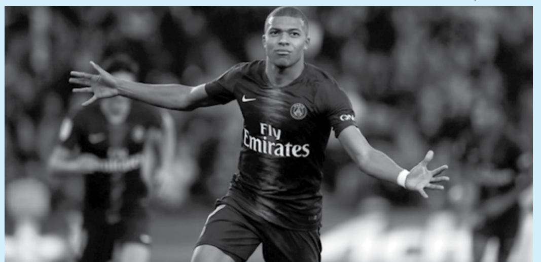
O Fair Play Financeiro está sendo trapaceado, segundo Javier Tebas, analisando a situação do PSG de Mbappé

"Eu disse a dois anos atrás que PSG e Manchester City estavam trapaceando, e isso (as investigações) não me surpreendeu de fato", disse Tebas em entrevista à Goal. "É muito importante que a Uefa faça algo de verdade sobre isso. É algo que desequilibra o futebol mundial e a estrutura do