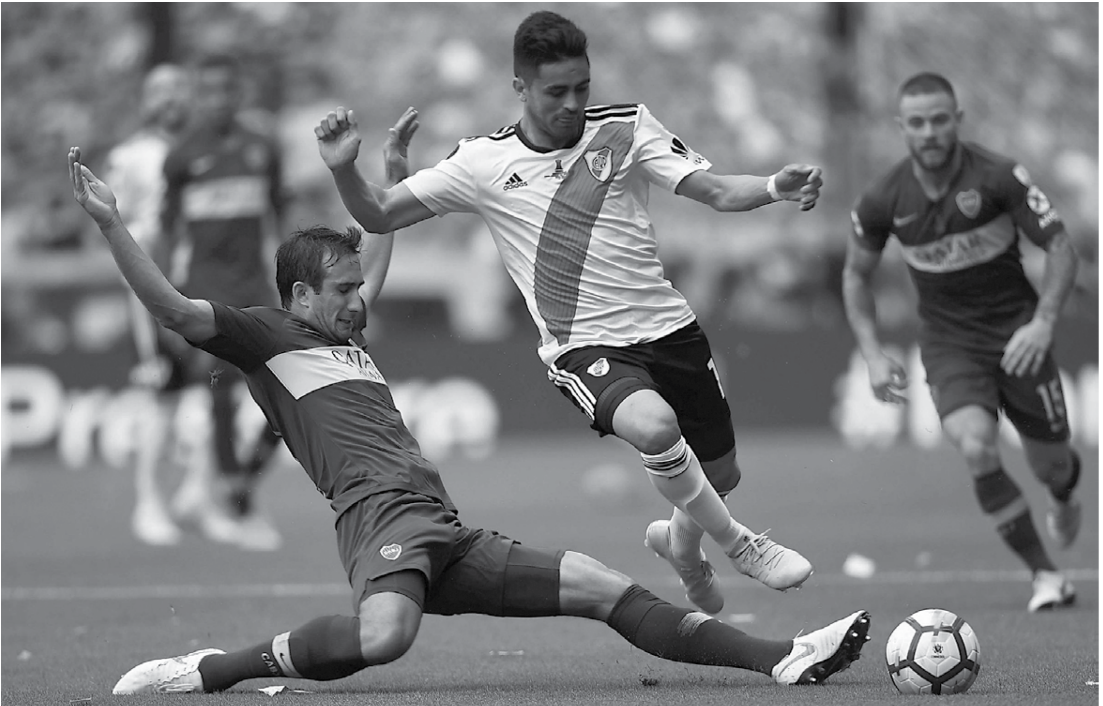
Boca Juniors e River Plate estão decidindo a Taça Libertadores deste ano. No primeiro jogo houve empate de 2 a 2 na Bombonera e no próximo sábado acontece o jogo de volta no Monumental de Núñez. Novo empate, decisão nos penaltis