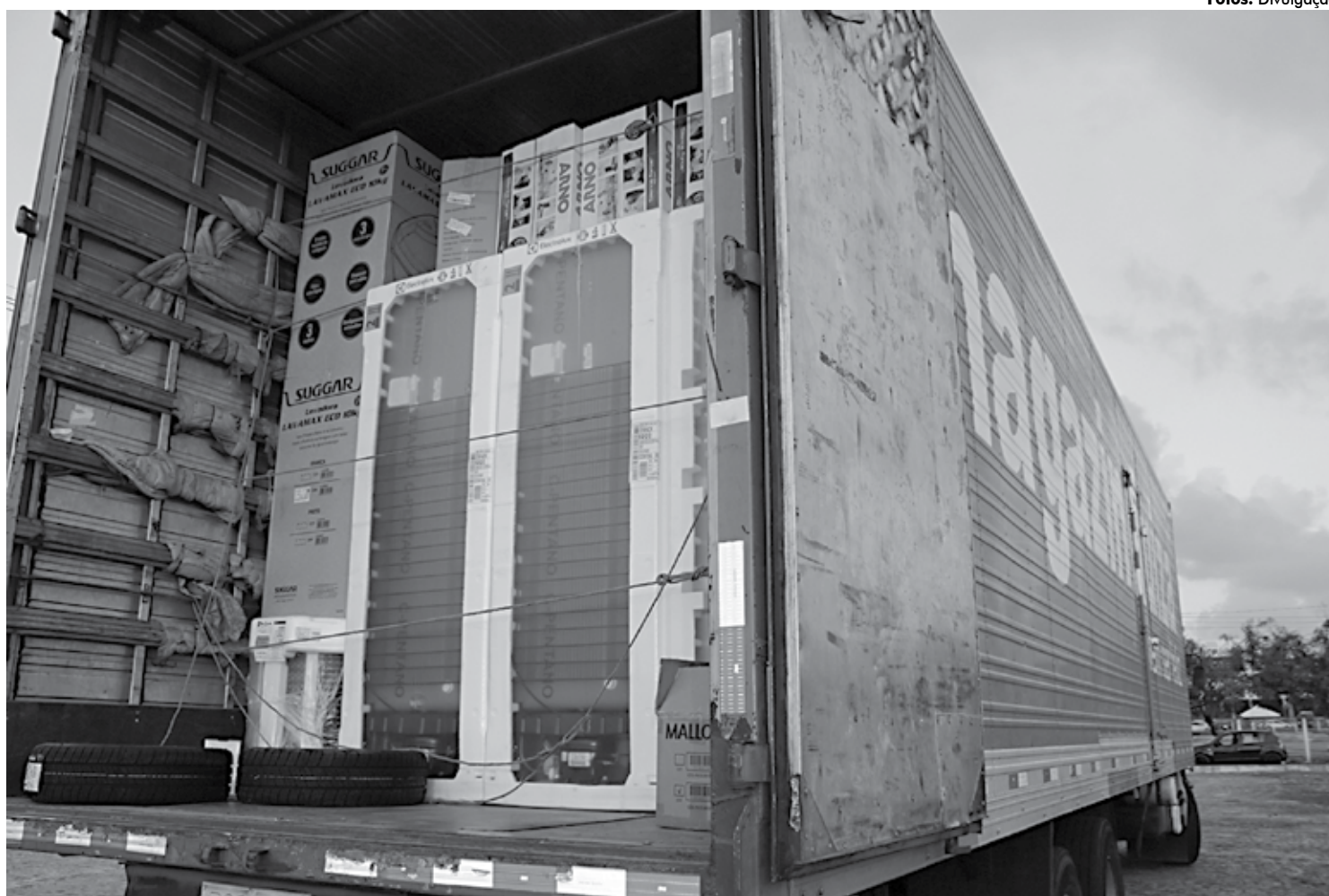
O caminhão com toda a carga foi localizado durante diligências das Polícias Civil e Rodoviária Federal e permitiu a prisão do grupo de assaltantes