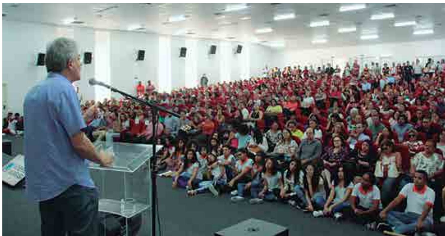
O auditório ficou lotado para ouvir o governador anunciar a abertura das matrículas na rede pública de ensino e a expansão das escolas integrais no Estado

Na ocasião, Ricardo Coutinho acompanhou apresentações culturais em alusão ao Dia Nacional da Consciência Negra e enfatizou que a escola deve ser um espaço livre para o debate de ideias, para o incentivo à cultura e onde o respeito ao próximo prevaleça. "A expansão das Escolas Integrais consolidam o êxito de um modelo de ensino que dá protagonismo aos jovens e faz com que eles possam se expressar. É a educação que faz com que as pessoas sejam iguais e tenham capacidade de alcançar seus objetivos. Educação é cidadania. Além das disciplinas tradicionais, os alunos devem aprender,