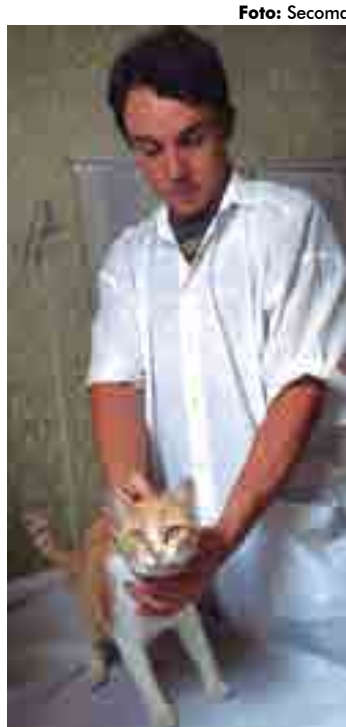
O atendimento é sempre às terças-feiras, sem precisar marcar

A Prefeitura de Conde, por meio da Secretaria de Saúde e Departamento de Vigilância em Saúde, iniciou ontem, (20), o atendimento clínico veterinário gratuito para animais de estimação de moradores de Conde. O atendimento é semanal, sempre às terças-feiras, no período da manhã e tarde, sem precisar marcar, basta comparecer com seu animal na Sede da Vigilância em Saúde, que fica na Rua Projetada, S/N, Centro, vizinho ao Instituto de Assistência e Previdência do Município (IPAM).