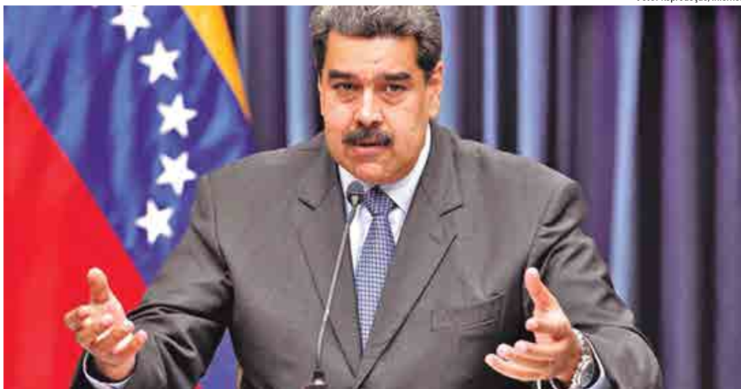
O governo de Nicolás Maduro é acusado de ter ligações com o terrorismo internacional e pode sofrer sanções severas dos Estados Unidos

Além disso, especialistas questionam os supostos vínculos da Venezuela com organizações terroristas internacionais. "Suspeito que isto (a inclusão na lista) se baseará em rumores e fon-